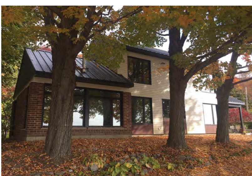
Des fenêtres de la cuisine, le fleuve, dans toute sa beauté, jour après jour, saison après saison.